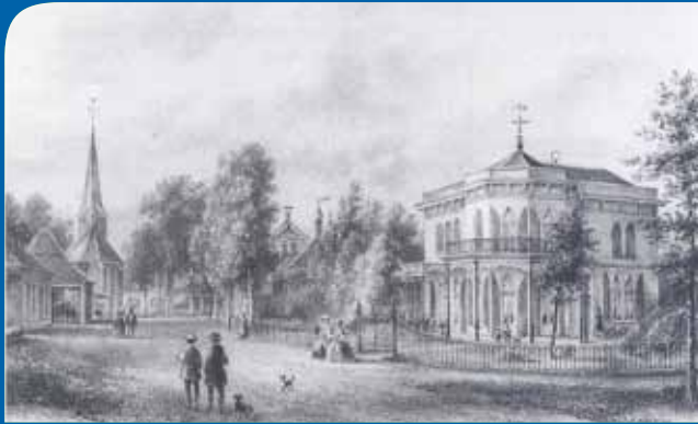
Villa Doornhoek aan de hoofdstraat (litho 1869)