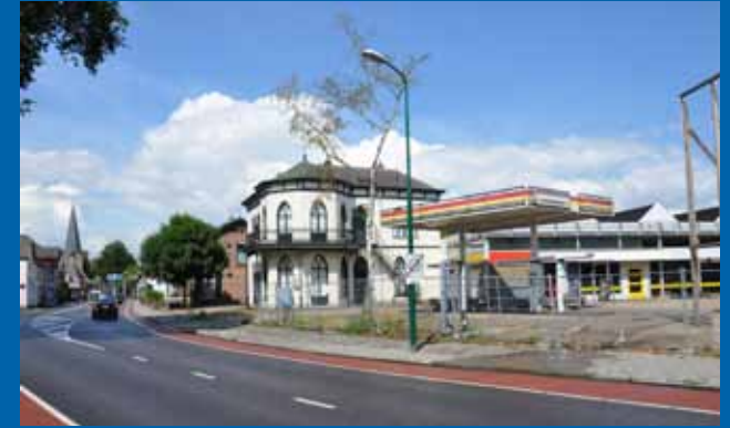
Villa Doornhoek nu