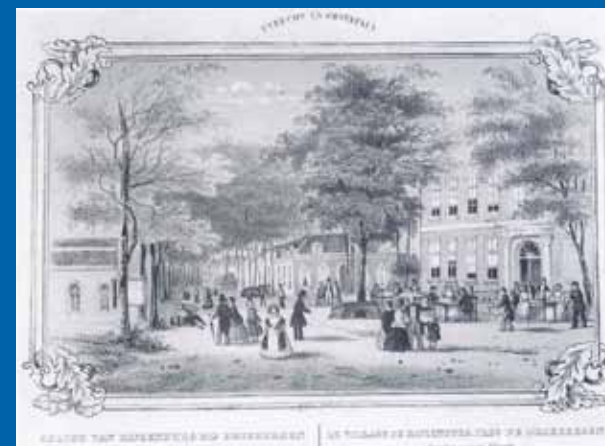
Gravure plein bij dorpskern Rijsenburg, gelegen op de huidige N225

gebruik wordt gedomineerd door de auto, wat ander gebruik moeilijker maakt. Daardoor is het in de huidige vorm vaak eerder een barrière dan een centrale zone. Door een andere inrichting, en door de positie van de auto te degraderen kunnen nieuwe kansen ontstaan voor de N225 als openbare ruimte.