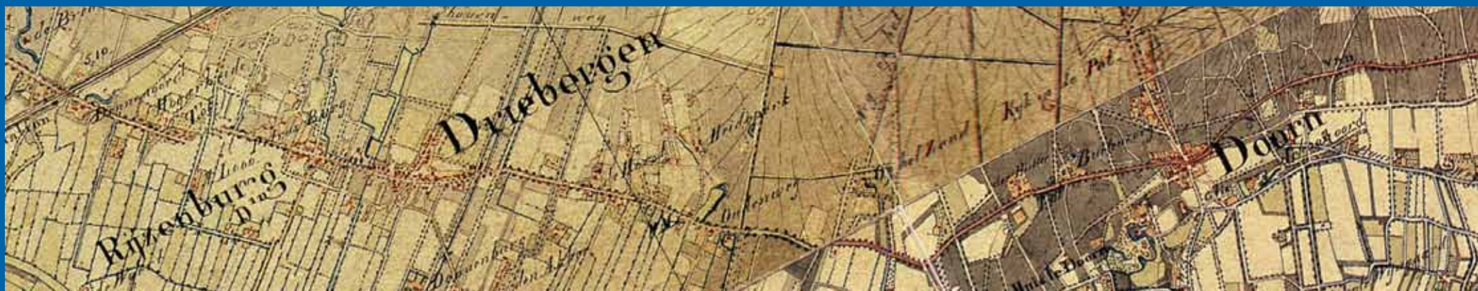
Banddorp topografische kaart 1839 - 1859