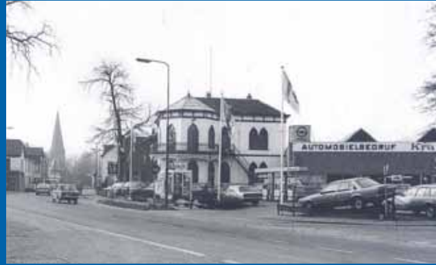
Villa Doornhoek op de zelfde plaats in de jaren '60